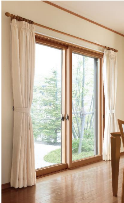
インプラス 対応窓種やカラーが豊富な、使い勝手に優れたシリーズ。

洗練されたデザインで機能性もバツグンの最新のリフォーム商品をいち早くご案内いたします。