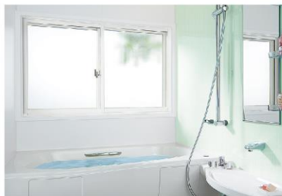
インプラス 浴室仕様 ユニットバスや在来浴室に後付けできる、浴室専用の商品。