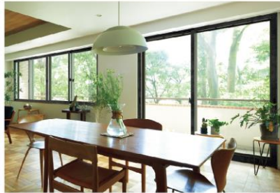
インプラス for Renovation 優れたデザイン性で空間に調和するリノベーションシリーズ。