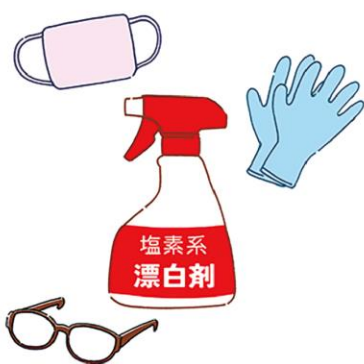
塩素系漂白剤はゴム手袋やメガネ、マスクなどをしてご使用を。

あり、酸性のものと混ぜると危険なので、ご注意を。 浴室を使用後、吸水スポンジやスクイーズで水気を取ると掃除の負担が軽くなります。