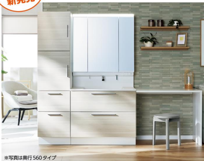
※写真は奥行560タイプ

新しい日常の暮らしに寄り添った洗面ドレッサーが誕生しました。モノをたっぷりしまえる奥行560タイプとコンパクトなサイズの奥行500タイプがあります。