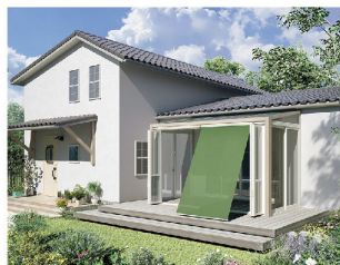
フォレストグリーン