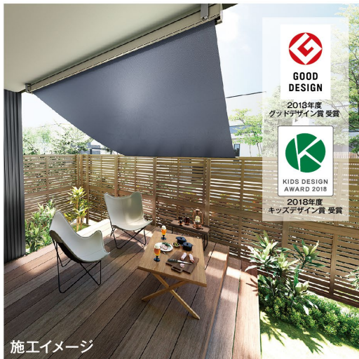
施工イメージ インディゴデニム