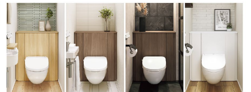
▲ライトオーク ▲ウォルナット ▲ショコラオーク ▲ホワイト